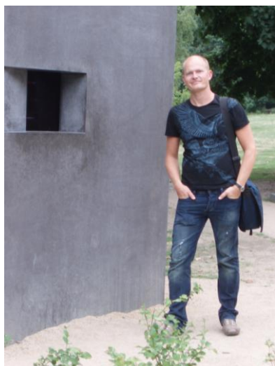
Skribenten foran et homomindesmærke i Berlin: en advarsel mod, hvad der sker, når småborgerlighed parres med ufornuft.

Læs lige sætningen igen og overvej dybden af argumentet. Danmarks justitsminister, kongerigets øverst ansvarlige for retfærdigheden, mener, at Danmark skal opretholde en diskriminerende lov, alene fordi alle lande i den tredje ve, for de er ganske enkelt imod alt det her halløj med regnbuefamilier og homoseksuel ligestilling. Men hvis man rent faktisk ønsker ligestilling mellem homo- og heteroseksuelle, er det eneste logiske standpunkt, at det ikke skal være den danske lovgivning, der stiller hindringer i vejen for de homoseksuelle. Men Brian Mikkelsen vil beskytte homoseksuelle adoptanter imod kinesisk diskrimination ved selv at diskriminere dem.